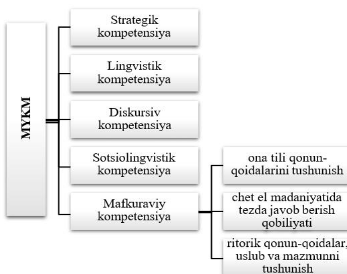
1.2-rasm. Madaniyatlararo yozuv kompetensiyasi modeli (MYKM)